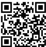
รายงานประจำปี 2566